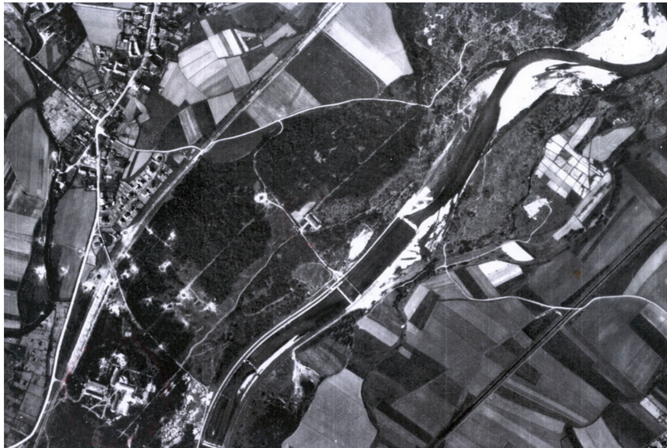
Luftbild von 1945 / aerial photograph from 1945